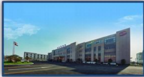
图表 1-1 现代化厂区

公司一直致力于从制造型向创造型企业的转变，以创新作为企业发展的制胜法宝，逐渐从顺兴制造迈向顺兴创造。顺兴制造为国内外众多客户提供了优质、高效、可靠的液压夹具系列和合模机系列，为客户创造了更大的价值空间。